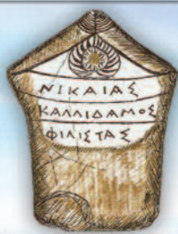
Επιτύμβια στήλη Δικαστρου (3ος-2ος αιώνας π. Χ.)