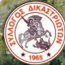
Άγιος Γεώργιος Δικαστρου Πολιούχος Άγιος της Κοινότητας (1525) Προστάτης Άγιος του Συλλόγου (1965)

ΤΡΙΜΗΝΙΑΙΑ ΕΝΗΜΕΡΩΤΙΚΗ ΕΚΔΟΣΗ ΤΟΥ ΣΥΛΛΟΓΟΥ ΤΩΝ ΑΠΑΝΤΑΧΟΥ ΔΙΚΑΣΤΡΙΩΤΩΝ