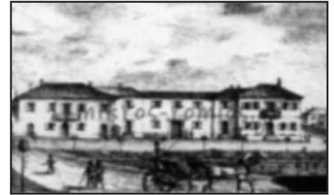
Προσωρινά ανάκτορα 1838, στην πλατεία Κλαυθμώνος (Μουσείο Αθηνών-Ίδρυμα Βούρου-Ευταξία)

Οι πανηγυρισμοί ενθουσίασαν και το βασιλικό ζεύγος, το οποίο βγήκε στην πόλη για να περιπατήσει στους δρόμους της, οι οποίοι φωτίζοντο, όπως και όλοι οι πάροδοι και τα σπίτια, με λαδοφάναρα (φανάρια με λάδι). Στις εκδηλώσεις συμμετείχαν και τα πολεμικά πλοία, τα οποία από το λιμάνι του Πειραιά χαιρετούσαν την εθνική εορτή της παλιγγενεσίας των Ελλήνων, με τους δικούς τους κανονιοβολισμούς. Το Πρόγραμμα δεν περιλάμβανε στρατιωτικές ή άλλες παρελάσεις, καθώς αυτές καθιερώθηκαν μετά το 1875.