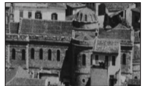
Ο Ναός της Αγίας Ειρήνης της οδού Αιόλου στα χρόνια της Εθνεγερσίας 1821.

Δάσος από σημαίες πλαισίωνε την άμαξα του βασιλέα, που στις εννέα το πρωί προχωρούσε πανηγυρικά προς την εκκλησία της οδού Αιόλου, ενώ ο λαός ξέσπαγε απ' όλες τις πλευρές σε ενθουσιώδεις ζητωκραυγές, καθώς έβλεπε το βασιλικό ζεύγος ντυμένο με ελληνικές λαϊκές φορεσιές...».