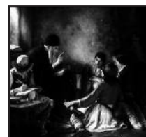
«Το κρυφό σχολειό» (1885/86), Νικολάου Γύζη

Ας ευχηθούμε, με την ευκαιρία της εφετινής επετείου του '21, στα δύσκολα αυτά χρόνια εθνολογικής, ιδεολογικής, υγειονομικής και οικονομικής δοκιμασίας της Πα-