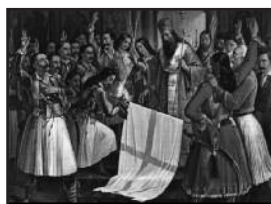
«Η ορκωμοσία των Αγωνιστών» Εθνική Πνακοθήκη (1865), Θεοδώρου Βρυζάκη

Ο Παλαιών Πατρών Γερμανός ευλογεί τη σημαία της επανάστασης, ενώ οι Έλληνες ορκίζονται στο Θεό για αυτήν. Ο μύθος της ύψωσης του λαθάρου στην Αγία Λαύρα σφειλείται στον Γάλλο ιστορικό Πουκεβίλ που έγραψε το 1824 την ιστορία της Ελληνικής Επανάστασης.