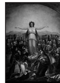
«Η Ελλάς Ευγνωμονούσα» (1858), Εθνικό Ιστορικό Μουσείο, Θεοδώρου Βρυζάκη