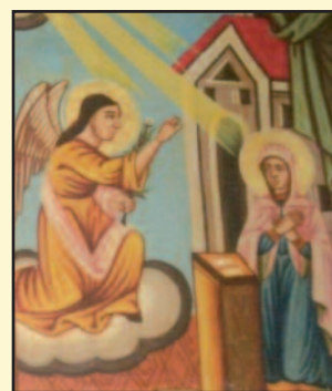
Ο Ευαγγελισμός της Θεοτόκου, εορτή 25ης Μαρτίου (Εικόνα στο Διάζωμα του Τέμπλου του Ναού Αγίων Σεραφείμ Δικάστρου)

Η 25η Μαρτίου είναι η ημέρα του Ευαγγελισμού της Θεοτόκου, κατά την οποία, όπως επιμαρτυρείται στο κατά Λουκάν Ευαγγέλιο, «εισελθών ο Άγγελος προς αυτήν είπε, χαιρε Κεχαριτωμένη ο Κύριος μετά Σού, ευλογημένη Συ εν γυναιξί... εύρες γαρ χάριν παρά τω Θεώ και ιδού συλλήψη εν γαστρί και τέξη Υιόν και καλέσει το όνομα αυτού Ιησούν... ούτος έσται Μέγας και υιός του Υψίστου κληθήσεται». Είναι και η ημέρα, η οποία ορίσθηκε από τον αρχηγό της Φιλικής Εταιρείας Αλέξανδρο Υψηλάντου, ως η ημερομηνία της έναρξης του υπέρ της ανεξαρτησίας αγώνος του Ελληνικού Έθνους, «ως ευαγγελιζομένη την πολιτικήν λύτρωσιν του ελληνικού έθνους». Ως ημέρα εθνικής εορτής του υπέρ της ανεξαρτησίας αγώνος του Ελληνικού έθνους του 1821, καθιερώθηκε στις 15 Μαρτίου του 1838, με Διάταγμα του Βασιλιά Όθωνα, το οποίο όριζε την 25 Μαρτίου «ως ημέραν εθνικής εορτής»: «...Θεωρήσαντες, ότι η ημέρα της 25ης Μαρτίου είναι λαμπρά και καθ' αυτήν εις πάντα Έλληνα, δια την εν αυτή τελουμένην εορτήν του Ευαγγελισμού της Θεοτόκου, είναι προσέτι λαμπρά και χαρμόσυνος, δια την κατ' αυτήν την ημέραν έναρξιν του περί της ανεξαρτησίας αγώνος του ελληνικού Έθνους, καθιερούμεν την ημέραν ταύτην εις το διηνεκές ως ημέραν εθνικής εορτής».