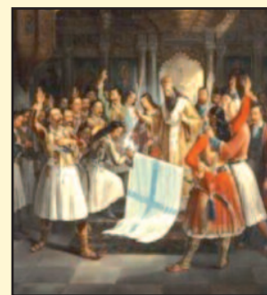
Ο Π. Πατρών Γερμανός ευλογεί την ελληνική σημαία της εξέγερσης του 1821 (Πίνακας θ. Βρυζάκη).