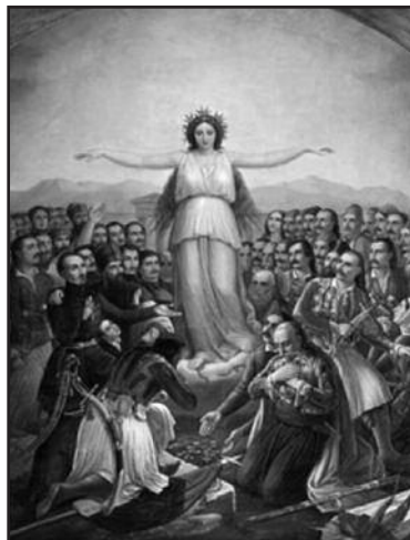
Η Ελλάς στεφανωμένη και ευγνωμονούσα εν μέσω των αγωνιστών του 1821, έχουσα σπάσει τις αλυσίδες της σκλαβιάς. (Πίνακας Θ. Βρυζάκη)