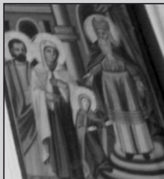
Εικόνα από το τέμπλο του Ναού της Παναγίας Δικάστρου.

γράφει ο Λεωνίδας Ιωάννου Καρφής, Αντιστράτηγος ε.α.